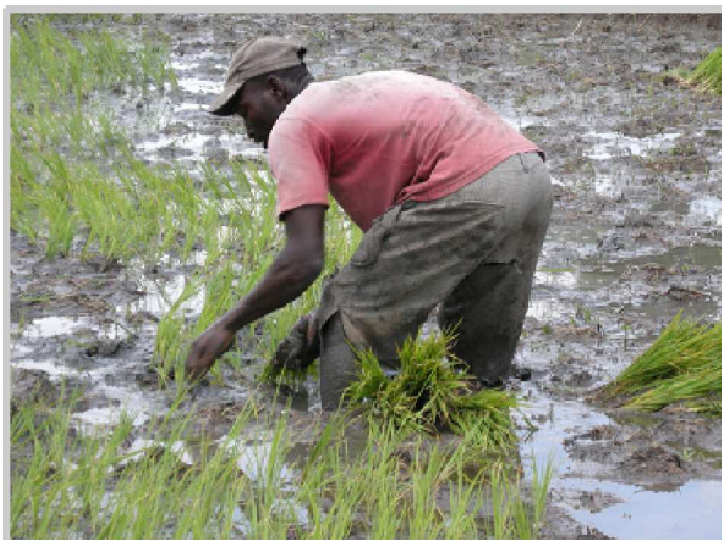
Repiquage du riz en Haïti Avril 2013