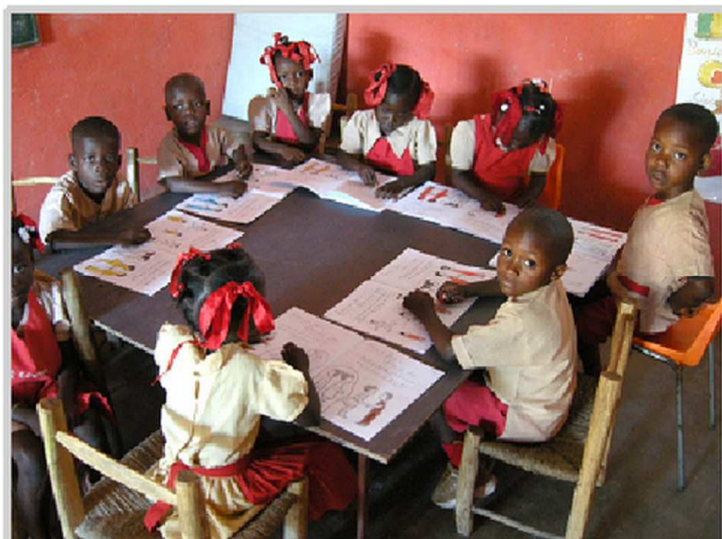
Classe de maternelle Allaire Verrettes Avril 2013

Dans son dernier message, le Père Toussaint CHERY « transmet ses meilleurs vœux aux donateurs ».