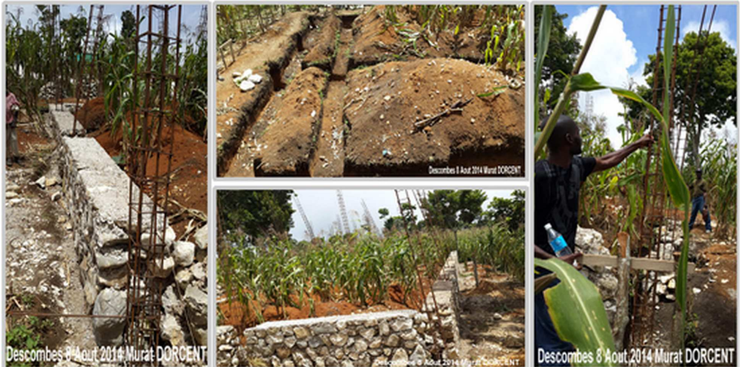
Suite des travaux début janvier 2015