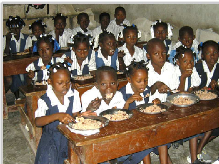
Cantine à St Guillaume Avril 2013