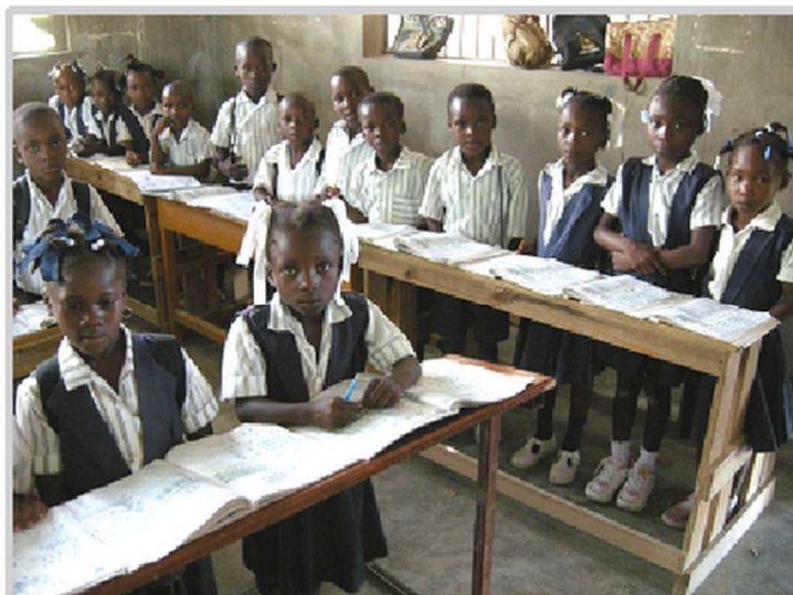
Classe à St Guillaume à La Chapelle Avril 2013